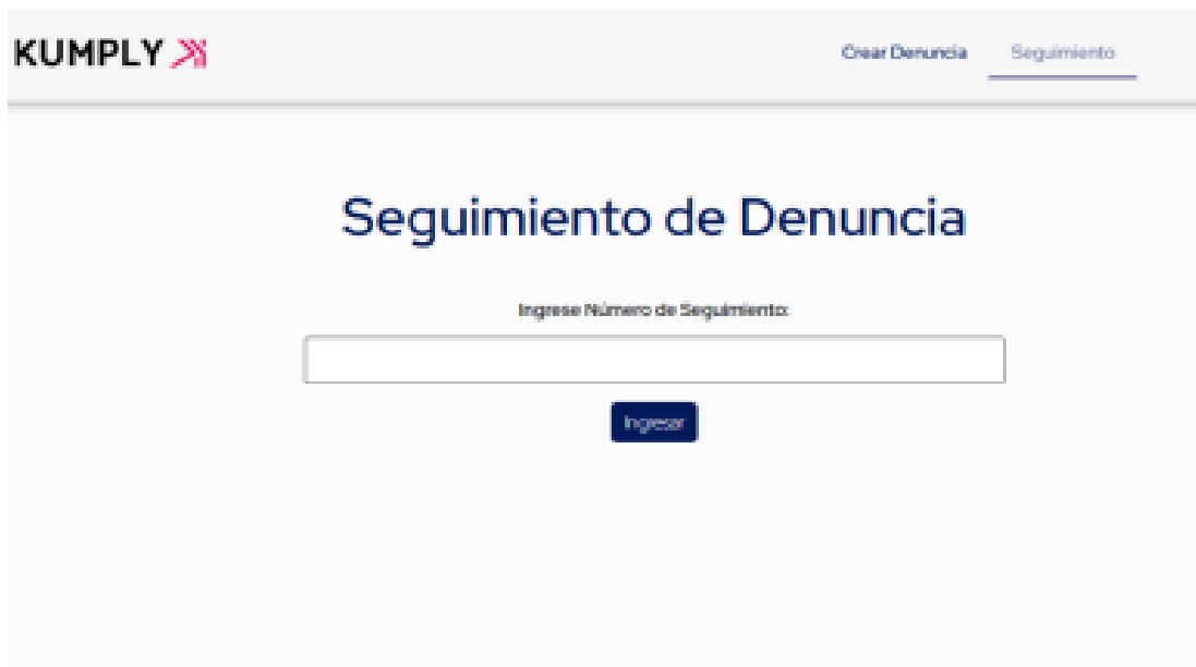
Imagen 2: Dónde consultar mi denuncia.