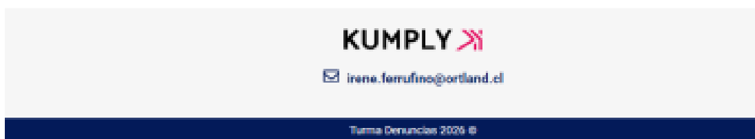
Imagen 3: Seguimiento en línea Denuncias Ingresadas